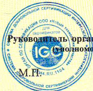
Схема сертификации 1а

Руководитель органа по сертификации (уполномоченное лицо)